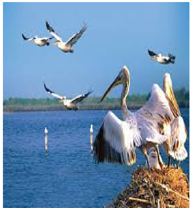
Εικόνα 4,Υδροβιότοπος Δαδιάς