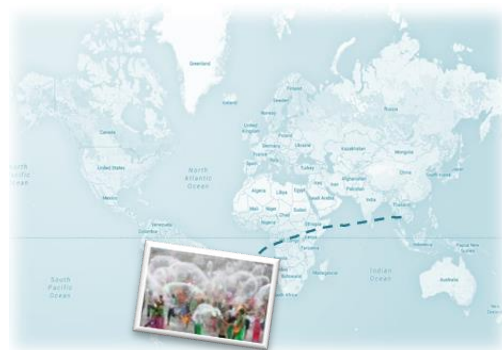
Figure 1. Songkran Festival i Thailand

Denna gemensamma aktivitet kan också ske online med hjälp av Google-earth. En lista över traditionella seder kan också skapas på nätet och relevant diskussion kan hållas i LINC-community